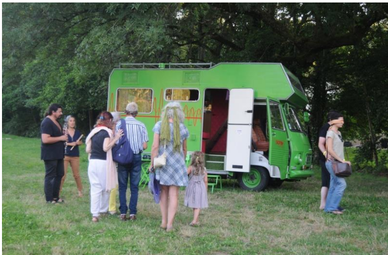
BENJAMIN BONDONNEAU sonoparadiso

Exploration de l'étonnant camping car, les yeux bandés !