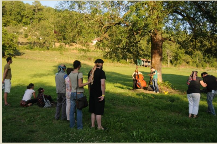
Parcours d'écoute les yeux bandés.....